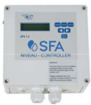
Cuadro de control ZPS Versión con una bomba